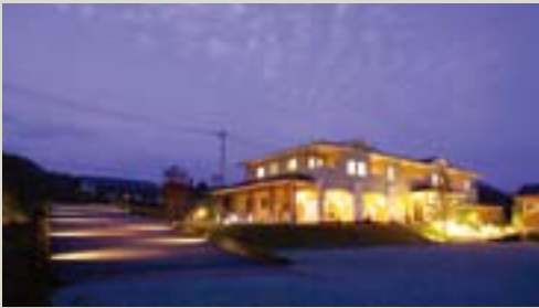
自然の色に身をゆだね思いのままに過ごす休日